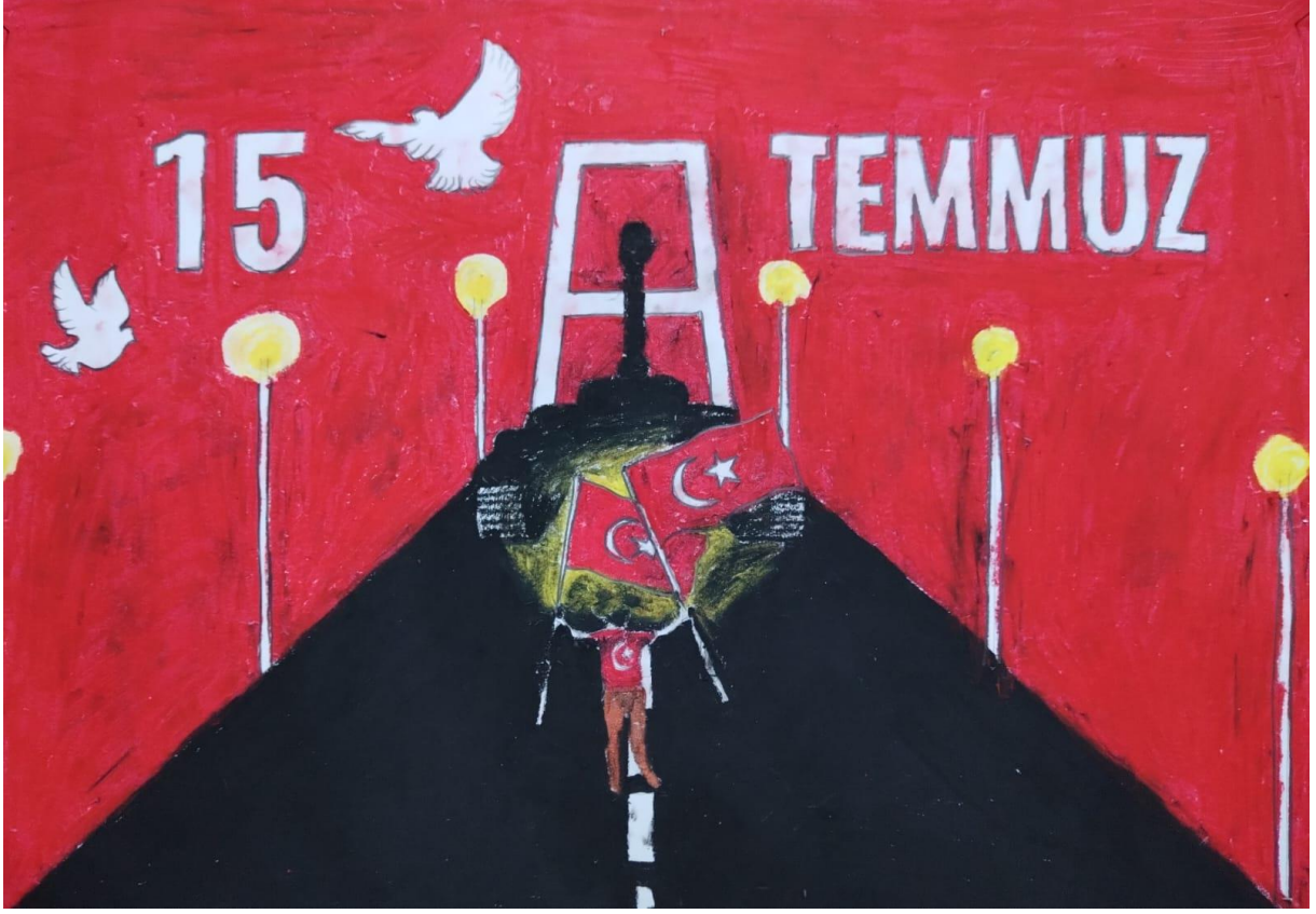
8-A SULTAN KANAL